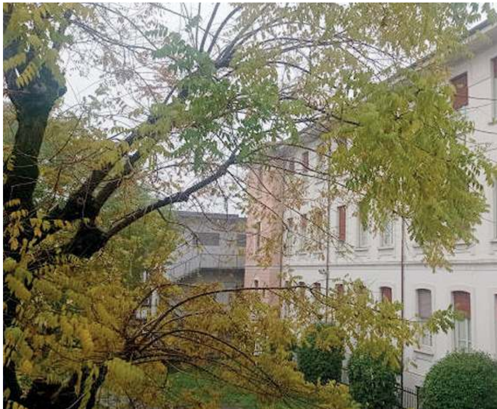
Due sedi. Il Fortuny Moretto si trova in via Berchet e via Apollonio a Brescia