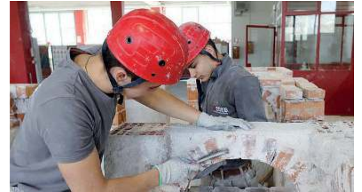
In laboratorio. Allievi alle prese con l'attività pratica