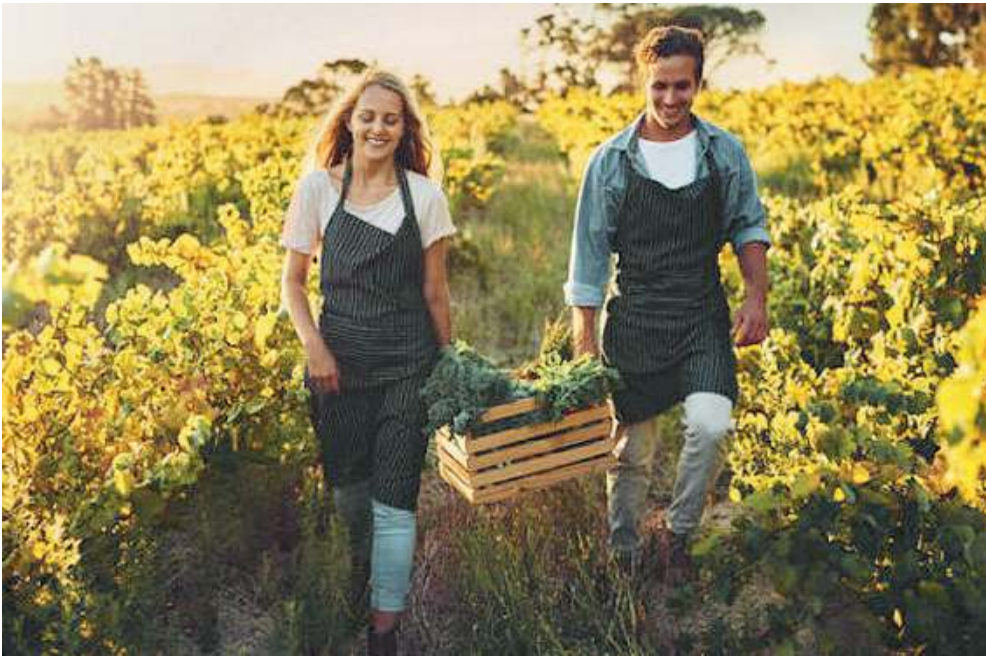
A scuola. Sono molto richiesti i corsi di studio dedicati ad agricoltura e valorizzazione dei prodotti del territorio