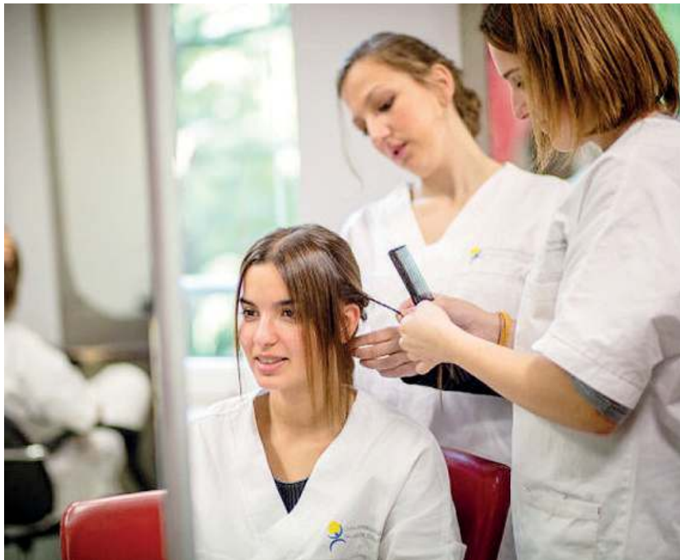
Alla prova. Studenti del Cfp Zanardelli si cimentano con l'attività professionale per cui stanno studiando