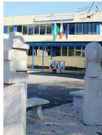
A Rezzato. La sede della Vantini

Durante il triennio vengono proposte agli alunni esperienze presso amministrazioni locali, enti culturali, imprese, consorzi per imparare diverse strategie comunicative. Chi partecipa sarà chiamato a promuovere e valorizzare le realtà che vogliono potenziare la propria capacità di attrazione cul-