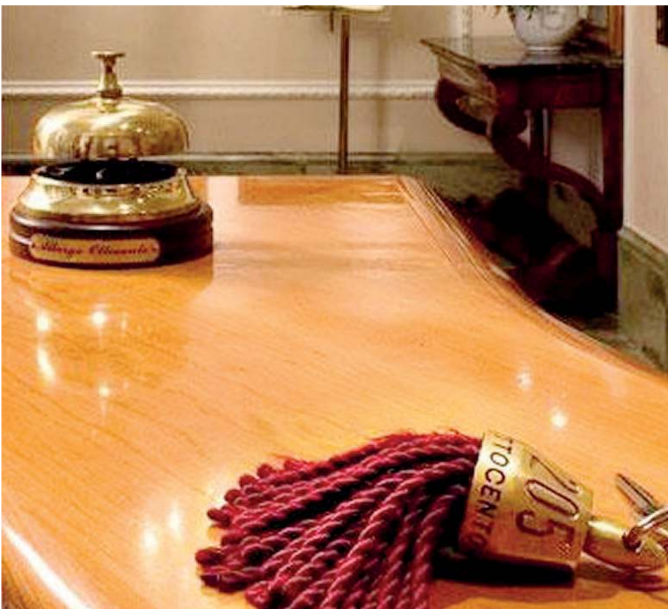
A lezione di accoglienza. Numerosi corsi consentono ai giovani di trovare un'occupazione

to di istruzione professionale nell'indirizzo che una volta era definito «alberghiero» ha specifiche competenze tecniche, economiche e normative nelle filiere dell'enogastronomia e dell'ospitalità alberghiera, nel cui ambito interviene in tutto il ciclo di organizzazione e gestione dei servizi. Dovrà utilizzare le tecniche per la gestione dei servizi enogastronomici e l'organizzazione della commercializzazione, dei servizi di accoglienza, di ristorazione e di ospitalità; occuparsi, in riferimento agli impianti, delle attrezzature e delle risorse umane; applicare le norme attinenti la conduzione dell'esercizio, le certificazioni di qualità, la sicurezza e la salute nei luoghi di lavoro; utilizzare le tecniche di comunicazione e relazione in ambito professionale orientate al cliente e finalizzate all'ottimizzazione della qualità del servizio; comunicare in almeno due lingue straniere; reperire ed elaborare dati relativi alla vendita, produzione ed erogazione dei servizi con il ricorso a strumenti informatici e a programmi applicativi; attivare sinergie tra servizi di ospitalità-accoglienza e servizi enogastronomici; inoltre curare la progettazione e programmazione di eventi per valorizzare il patrimonio delle risorse ambientali, artistiche, culturali, artigianali del territorio e la tipicità dei suoi prodotti. //