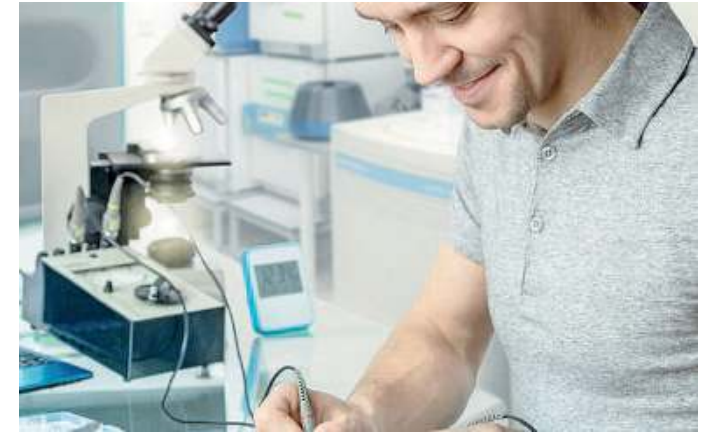
Con i giovani. Il Don Bosco accompagna gli studenti in molti modi