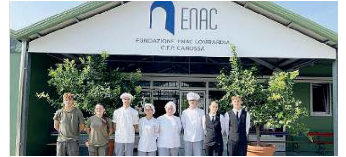
Dove. Numerosissime le proposte formative nelle sedi di Brescia e Bagnolo