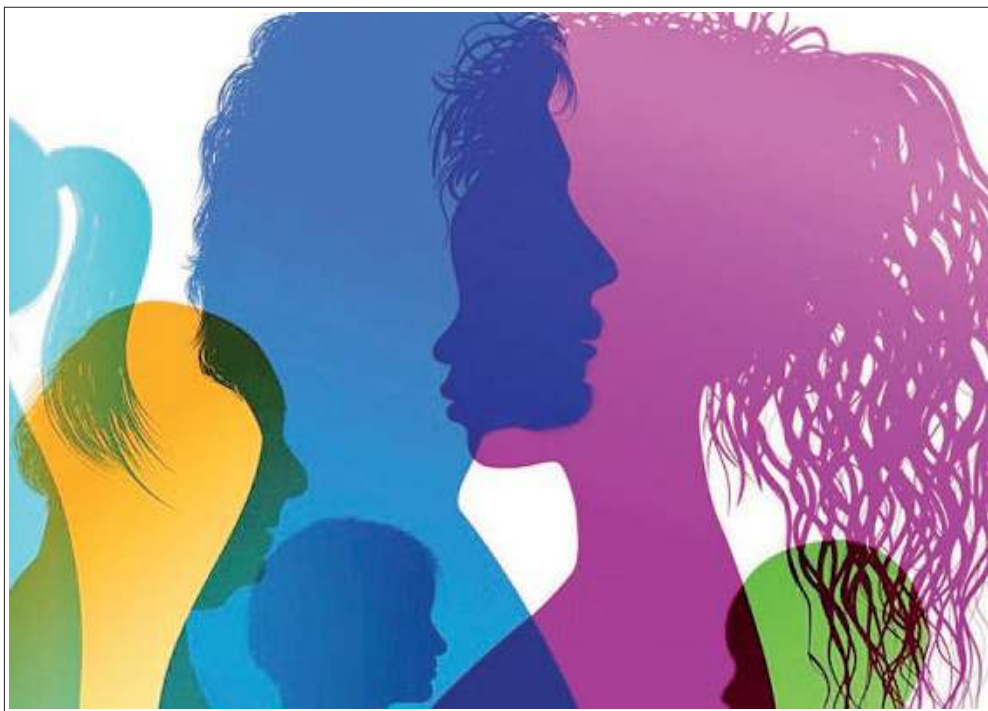
Complessità affascinante. Il Liceo delle Scienze umane porta ad approfondire molti aspetti dell'uomo