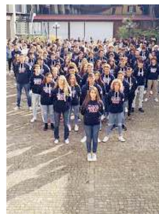
Oggi. La scuola è attiva dal 1954

■ Durante la lunga storia dei Licei Marco Polo, il punto fermo è sempre stata l'attenzione all'allievo che viene costantemente messo al primo posto di ogni progetto educativo. Un principio che lo storico istituto bresciano porta avanti da ben 69 anni: fin dal 1954, anno di fondazione, con un processo evolutivo che va di pari passo con i cambiamenti del mercato e con i mutamenti degli scenari. Oggi presenta ben tre corsi di liceo delle scienze umane, tre proposte formative di altissimo livello: Economico-sociale con potenziamento sportivo; Economico-sociale con potenziamento linguistico; Economico-sociale.