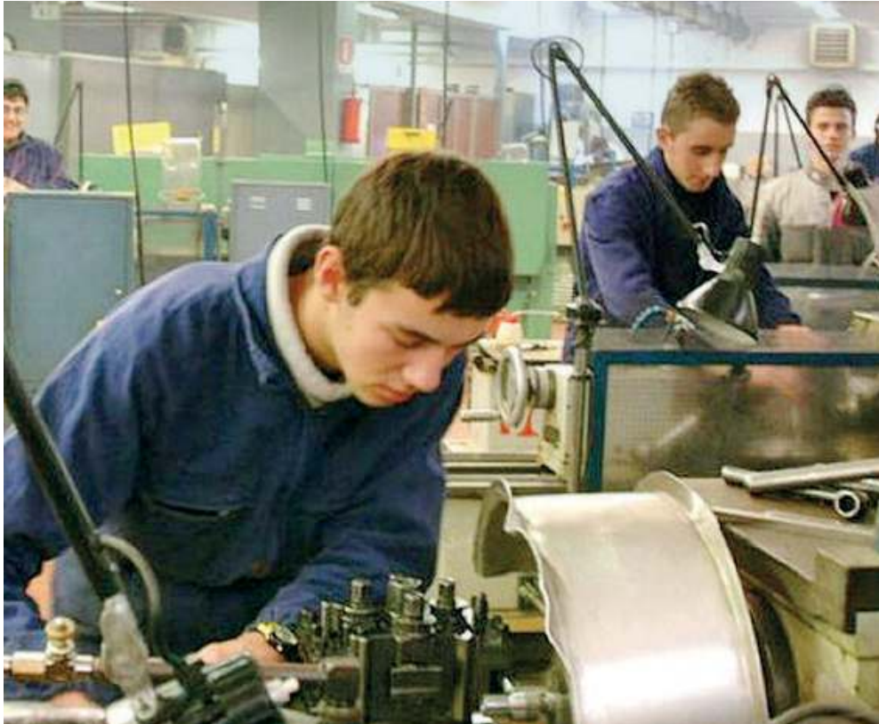
Verso il lavoro. Dalla formazione professionale esempi virtuosi di interazione tra scuola e territorio