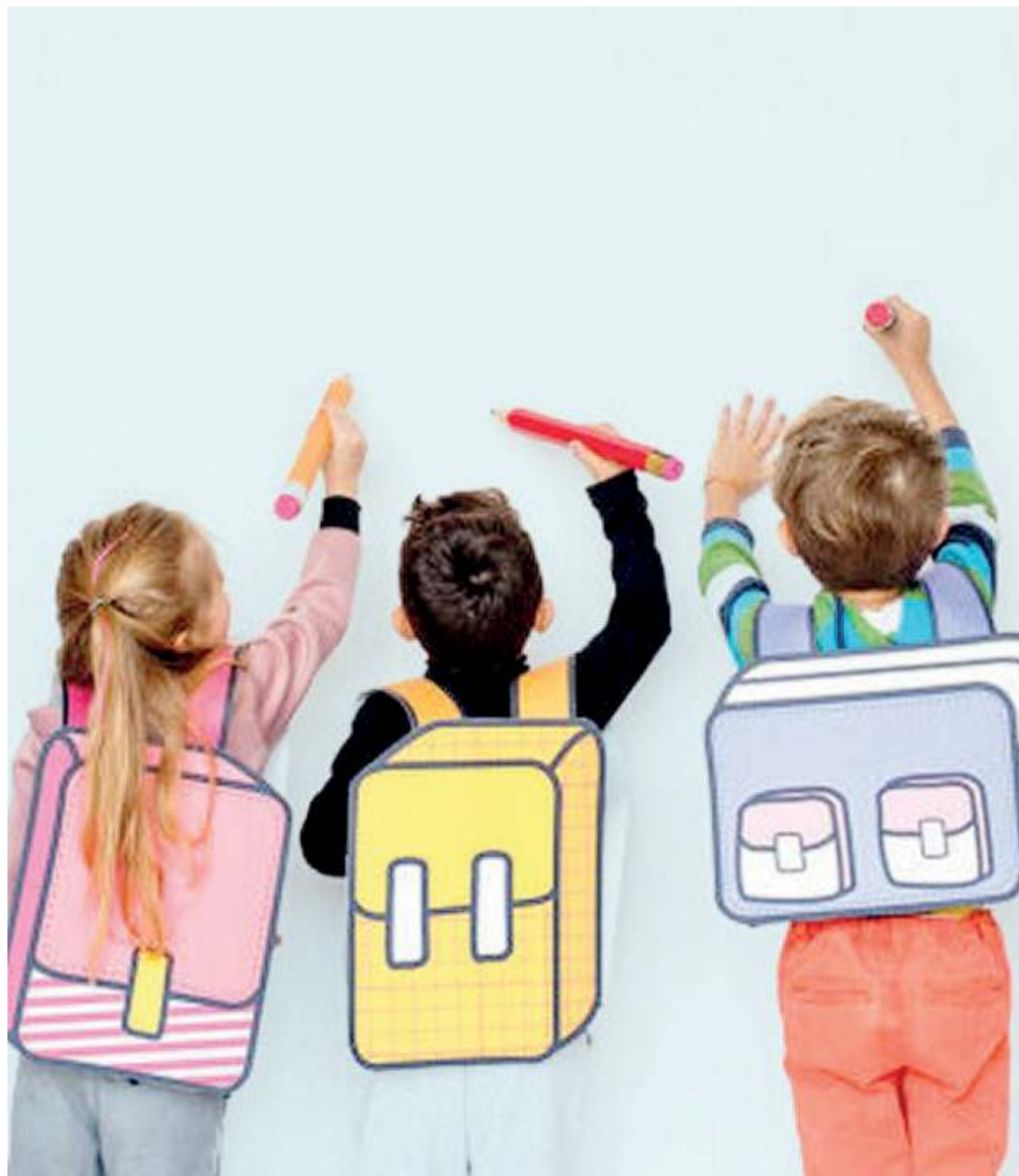
In crescita. L'ingresso nella scuola primaria rappresenta un avvenimento fondamentale nella vita dei bambini

La scuola primaria. La scuola primaria rappresenta per gli alunni un fondamentale momento di passaggio. È proprio in essa, infatti, che avviene la graduale transizione dall'insegnamento pre-disciplinare a quello fondato su diverse discipline. L'obiettivo della scuola primaria è lo sviluppo del-