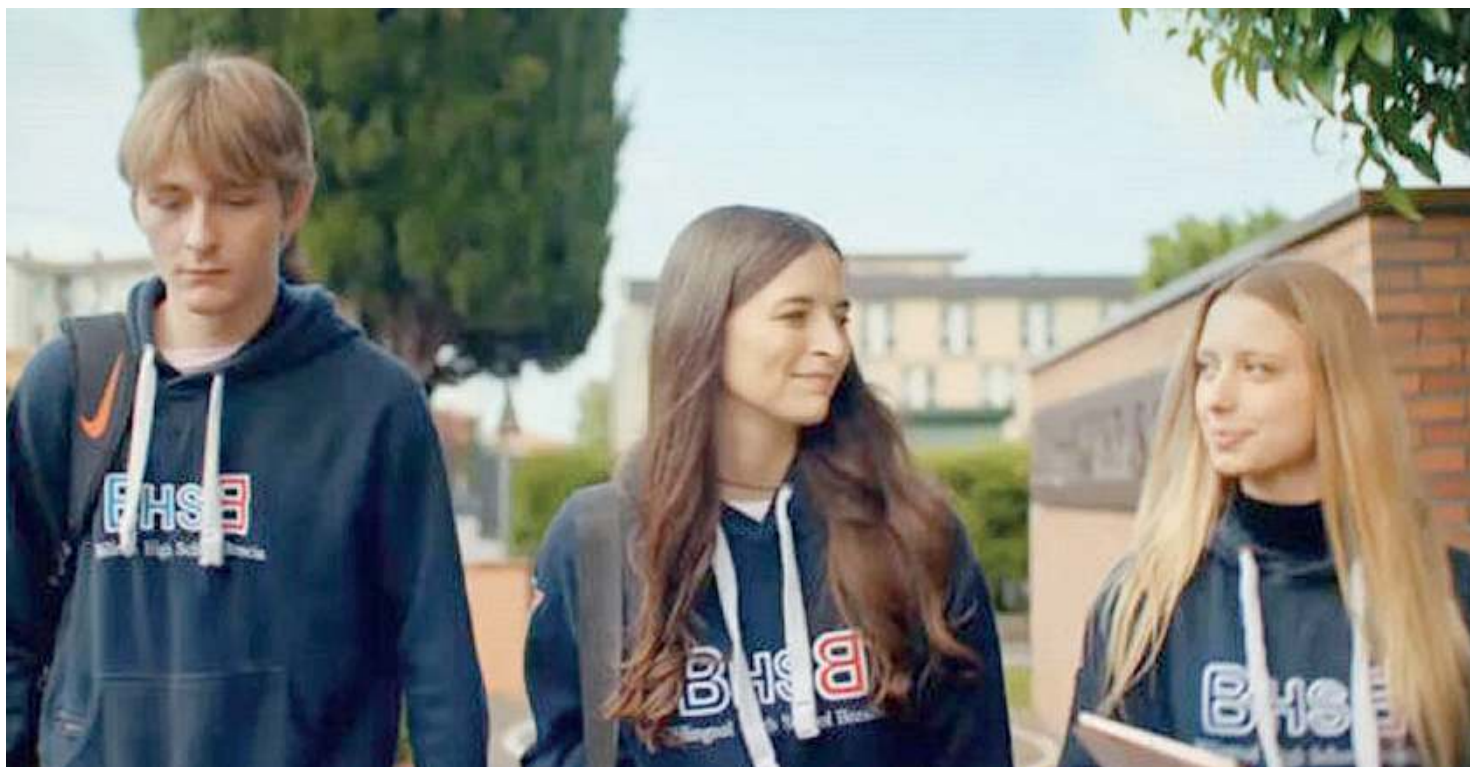
Dove. La Bilingual Middle School di Brescia ha sede in via Ferrando 1