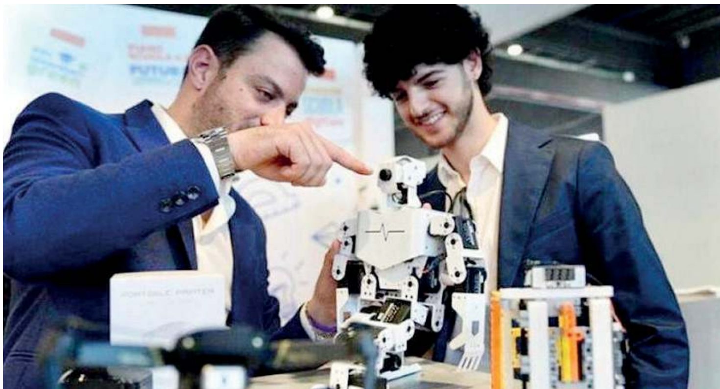
Ottima opportunità. Gli Its sono frequentati da studenti provenienti tanto dai Cfp quanto dai licei