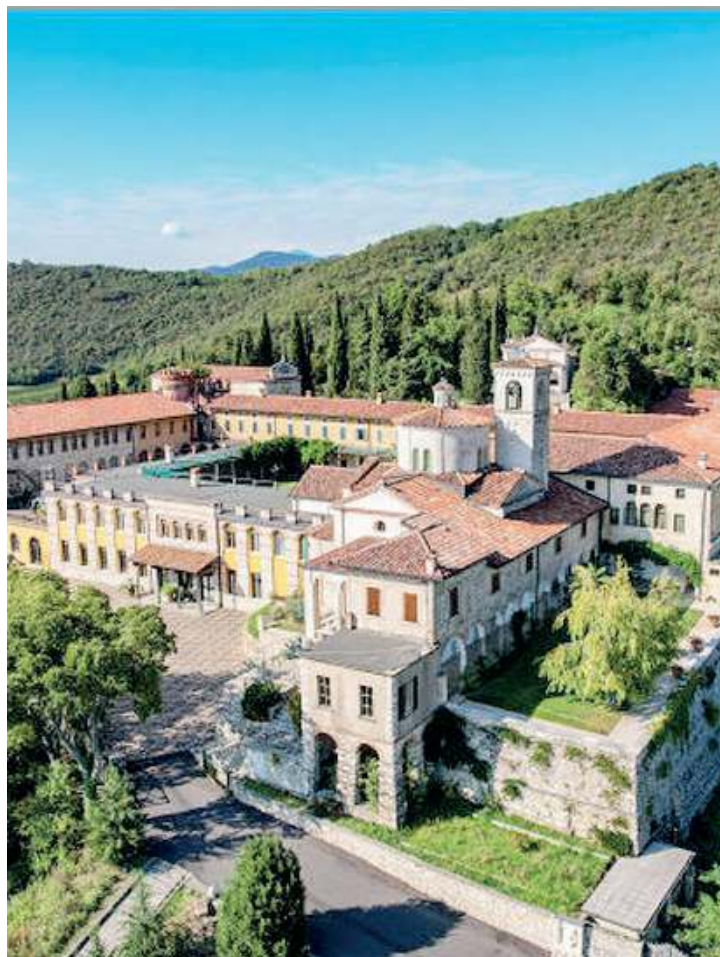
In Franciacorta. L'Accademia Symposium ha sede a Rodengo Saiano

Sono cinque i corsi Its proposti da Accademia Symposium: «Marketing e Turismo del Vino», dall'approccio internazionale, che lega il mondo del vino al marketing e all'hospitality; «Enologia e Viticoltura sostenibili», per imparare i processi più all'avanguardia di produzione e lavorazione in vigneto e cantina; «Filie gastronomiche e Processi alimentari», ideale per entrare subito nel mondo delle eccellenze produttive alimentari; «Sistemi zootecnici e Trasformazione agroalimentare», per chi vuole lavorare nella filiera agricola e zootecnica; infine il nuovo corso «Agricoltura 4.0 e Sostenibilità dei sistemi culturali», ideato per rispondere alle esigenze delle aziende della filiera agroalimentare orientate alla meccanica di