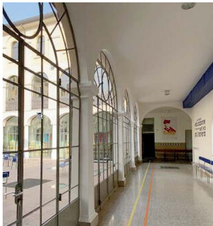
In piena luce. Un ambiente interno della Scuola Santa Dorotea

La Scuola Santa Dorotea è una realtà piccola ma vivace, che ha sede in un ampio spazio di un prestigioso palazzo di via Marsala 30, offre come seconda lingua comunitaria sia lo spagnolo sia il tedesco e affianca alle materie di insegnamento tante attività: certificazioni Cambridge e Dele, teatro, scacchi, coding, Kangourou,