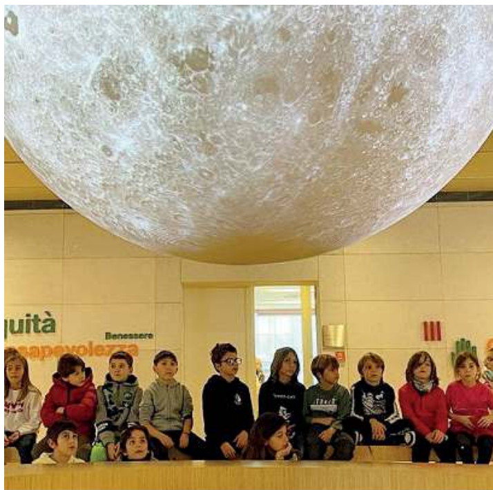
Alla scoperta. Piccoli alunni della Novalis Open School al Muse di Trento

damentale: non è raro che nella bella stagione alcune lezioni si tengano all'aperto, nel frutteto della scuola; e non mancano neppure le esperienze di teatro nel bosco e la possibilità di prati-