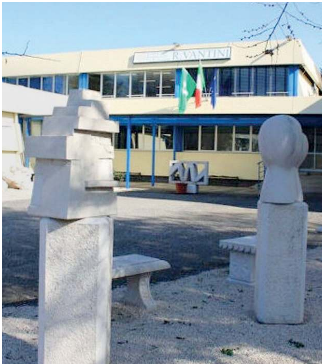
Dove. La Scuola Vantini ha sede a Rezzato, in via Caduti di piazza della Loggia 7/B

Per chi vuole imparare a utilizzare i social media, organizzare eventi promozionali, supportare le amministrazioni del territorio a far conoscere i propri beni culturali e i propri servizi; aiutare importanti aziende locali e non solo nel loro piano di Marketing, la Scuola propone il corso adatto di Operatore alla promozione e accoglienza-marketing territoriale. Seguendolo, i giovani impareranno a utilizzare i social media come canali promozionali, studieranno due lingue e sperimenteranno, attraverso attività di laboratorio, la creazione di foto, grafica e video promozionali. L'operatore marketing utilizza le più moderne strategie di comunicazione, web e social media per promuovere e organizzare eventi per la cultura, le istituzioni e le imprese. Durante il triennio si acquisiscono competenze e tecniche per valorizzare i prodotti culturali, turistici e d'impresa e si possono fare esperienze di stage presso amministrazioni locali, enti culturali, imprese, consorzi e imparando sul campo diverse strategie comunicative. L'operatore sarà chiamato a promuovere e valorizzare la realtà che vogliono potenziare la propria capacità di attrazione