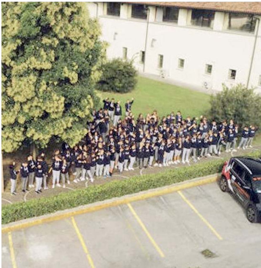
Insieme. Studenti del Liceo Marco Polo nella sede di via Ferrando a Brescia

di apprendimento per tutti; ogni singolo studente è valorizzato e incentivato a scoprire e ricercare nuove esperienze e conoscenze. A garanzia di ciò, solo docenti altamente formati e qualificati e un ambiente educativo e sereno.