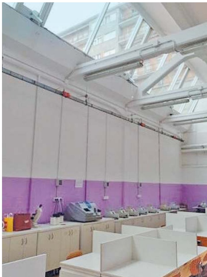
Rinnovata. La sede di via Apollonio a Brescia è stata recentemente ristrutturata

Questo perito è una figura molto richiesta dalle aziende per le competenze specifiche nell'ambito delle diverse realtà ideativo-creative, progettuali, produttive e di marketing del settore tessile e dell'abbigliamento. Nell'articolazione «Tessile, abbigliamento e moda», si acquisiscono le competenze che caratterizzano il profilo professionale in relazione alle materie prime, ai prodotti e processi per la realizzazione di tessuti tradizionali, oltre ai prodotti e processi per la realizzazione di capi di abbigliamento dal punto di vista tecnico. Questo corso si svolge nella sede di via Apollonio 21, a Brescia, che grazie all'intervento della Provincia ha appena ultimato un corpo-