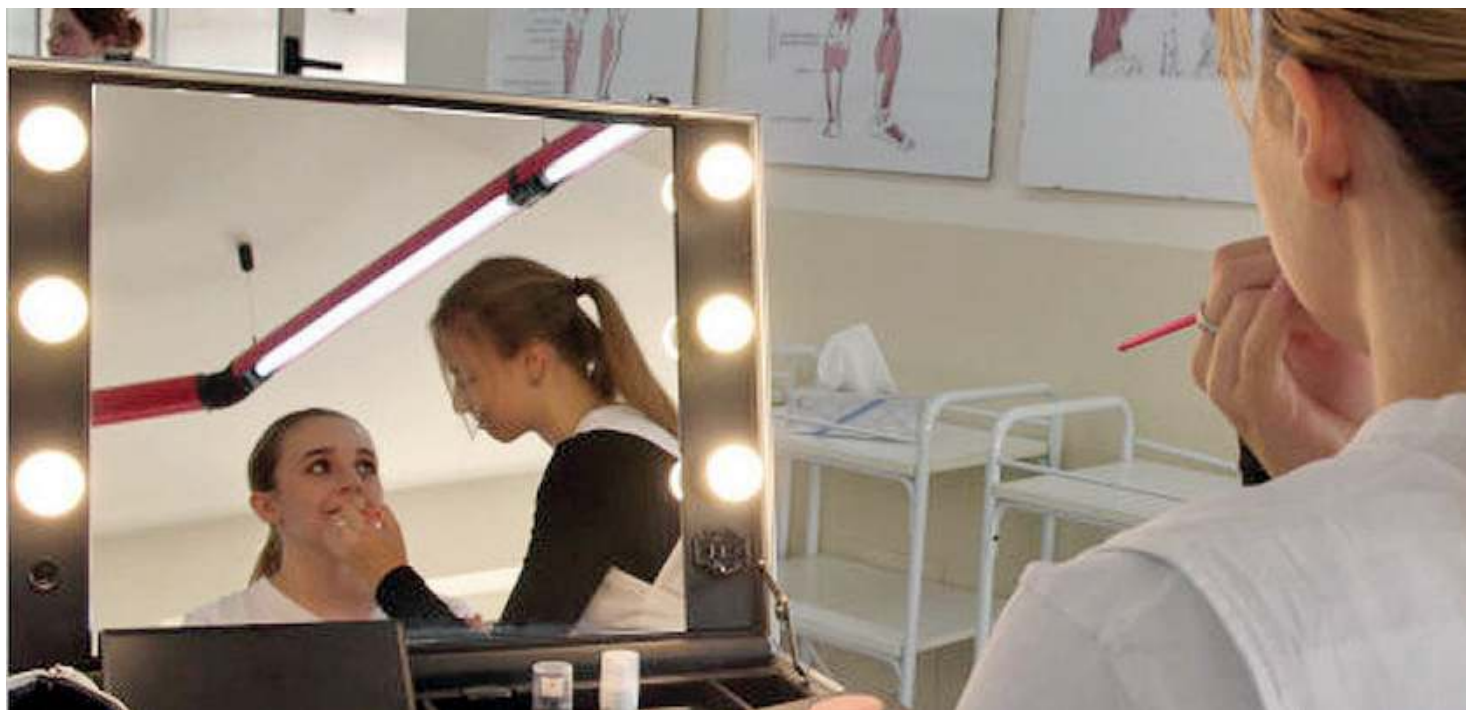
Operatori del benessere. Si può scegliere tra i corsi di Acconciatura e quello di Trattamenti estetici