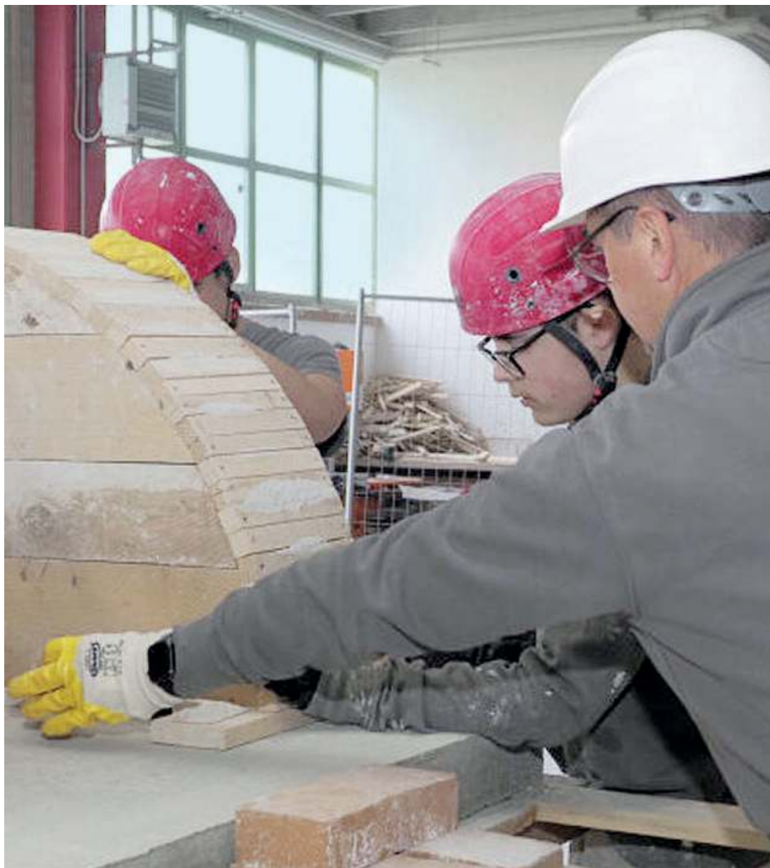
Sul campo. Tanta pratica per gli allievi della Scuola edile bresciana, che ha sede in via della Garzetta 51

Punto di riferimento. A Brescia, l'Ente sistema edilizia (Eseb), che ricomprende le attività della Scuola edile, si attesta come una delle realtà più innovative e qualificate per la preparazione dei futuri lavoratori del comparto delle costruzioni, distinguendosi anche a livello nazionale per la formazione di alto profilo erogata. L'Ente fornisce alle ragazze e ai ragazzi iscritti, in uscita dalle scuole medie, competenze ricercate dalle imprese edili locali e opera come anello di congiunzione tra il mondo della scuola e le opportunità lavorative offerte dalle aziende del territorio. Mettendo a disposizione spazi moderni, dotati di tecnologie funzionali all'apprendimento, con lavagne interattive, un campo mac-