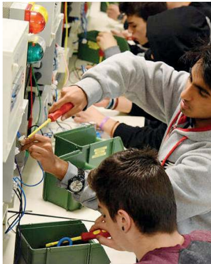
Alla prova. Gli allievi della Scuola Bottega in laboratorio

Continua intanto l'alternanza scuola lavoro che comprende anche esperienze all'estero, in particolare a Capoverde.