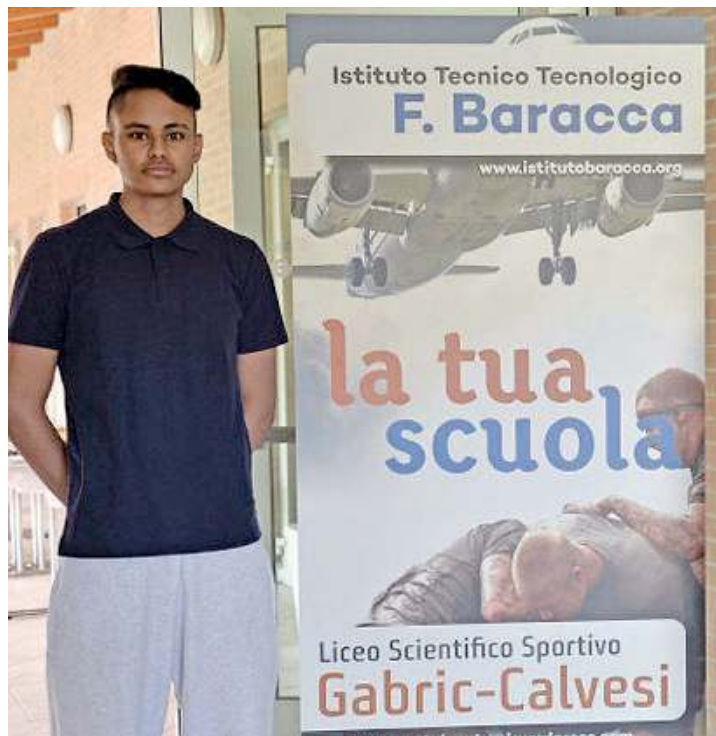
Testimonial. Uno studente della scuola

Unico a proporre tale specializzazione nel territorio, il «Baracca» può fare affidamento anche su una rete di rapporti con le attività produttive locali, che so-