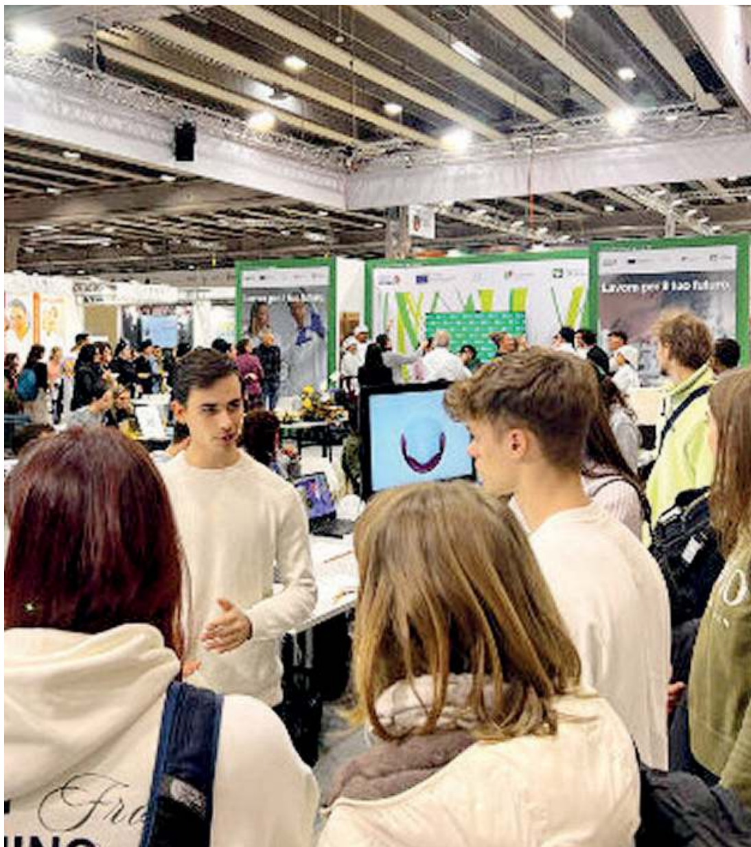
In cammino. Studenti dell'Its Lombardia Meccatronica

Metà dei docenti dell'Its proviene dal mondo delle imprese e soprattutto il monte ore di attivi-