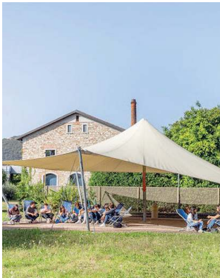
Nel verde. Il Liceo Carli si trova in via Stretta 175

Per le famiglie è sempre aperta la possibilità di prenotare un open day personalizzato telefonando al numero 030.221086 o mandando una mail all'indirizzo segreteria@liceoguidocarli.eu . //