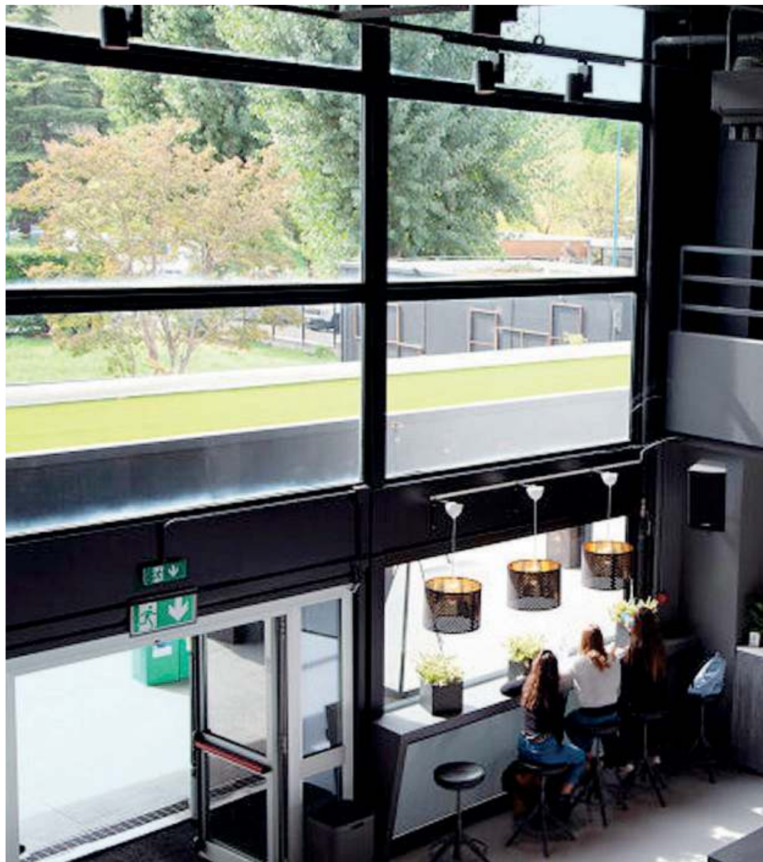
La sede. Ok School Academy ha una bellissima sede in via Reggio 12 a Brescia

Anche le esperienze formative all'estero sono un fiore all'occhiello della scuola che tra le varie opportunità offrirà ad aprile, a quasi 40 ragazzi, un soggiorno formativo in un altro continente favorendo in tal modo lo svilup-