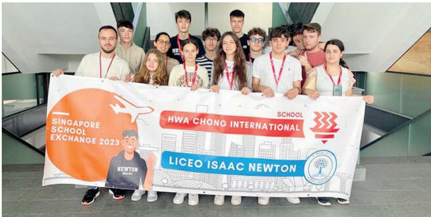
Internazionale. Il Liceo paritario «Isaac Newton» offre tra l'altro uno scambio culturale con una delle più importanti scuole di Singapore