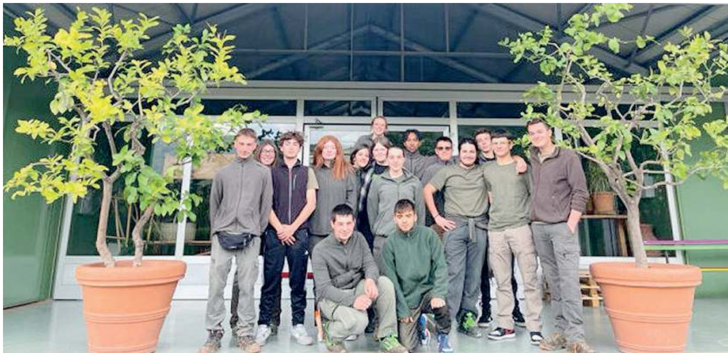
Verso il domani. Un gruppo di studenti del Cfp Canossa