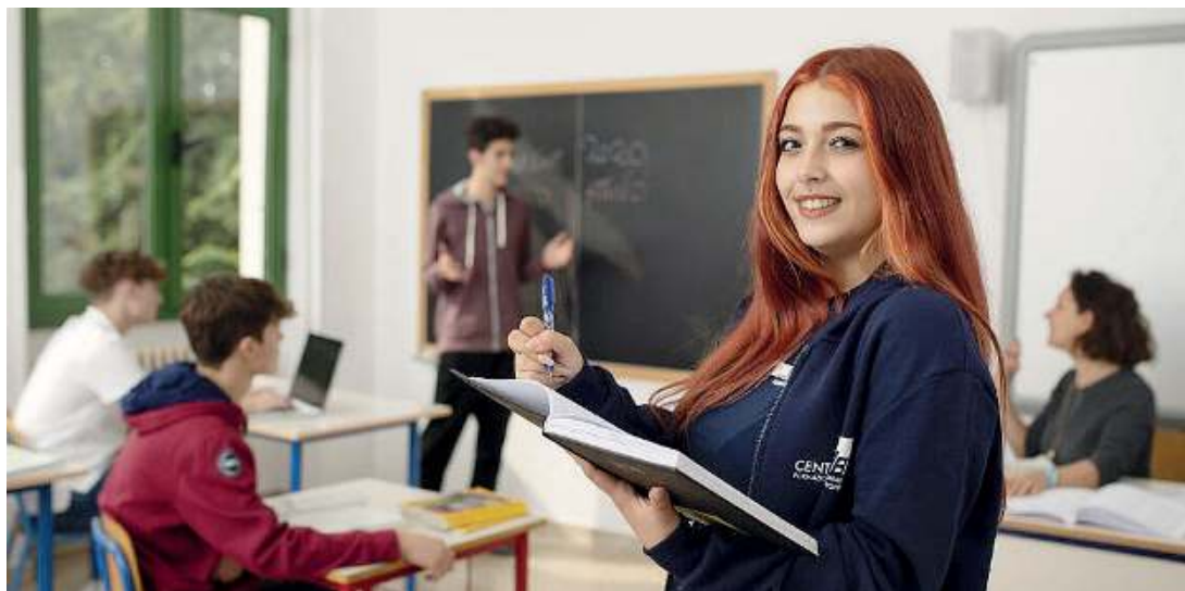
Col sorriso. Un'allieva di una scuola del Centro professionale Fondazione Aib

Le scuole di Cf Aib esprimono la propria vocazione meccanica, nella sede di Castel Mella e quel-