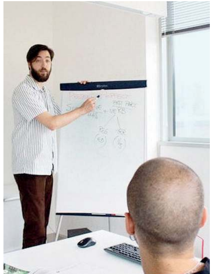
In classe. Una lezione dell'Iseo English Language School