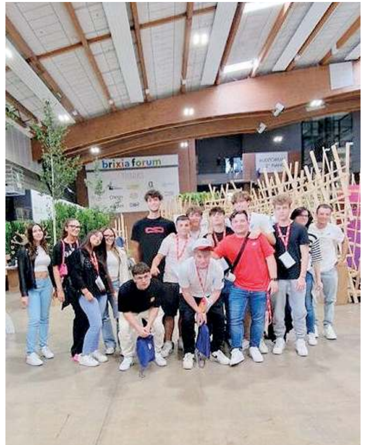
Soddisfatti. Studenti dell'Istituto Giovanni Paolo II

L'istituto si trova in via Aldo Moro 14 a Brescia Due; per prenotare un open day o ricevere ulteriori informazioni si può telefonare al numero 030.2421415 o scrivere un'email all'indirizzo segreteria@istitutogp2brescia.it . //