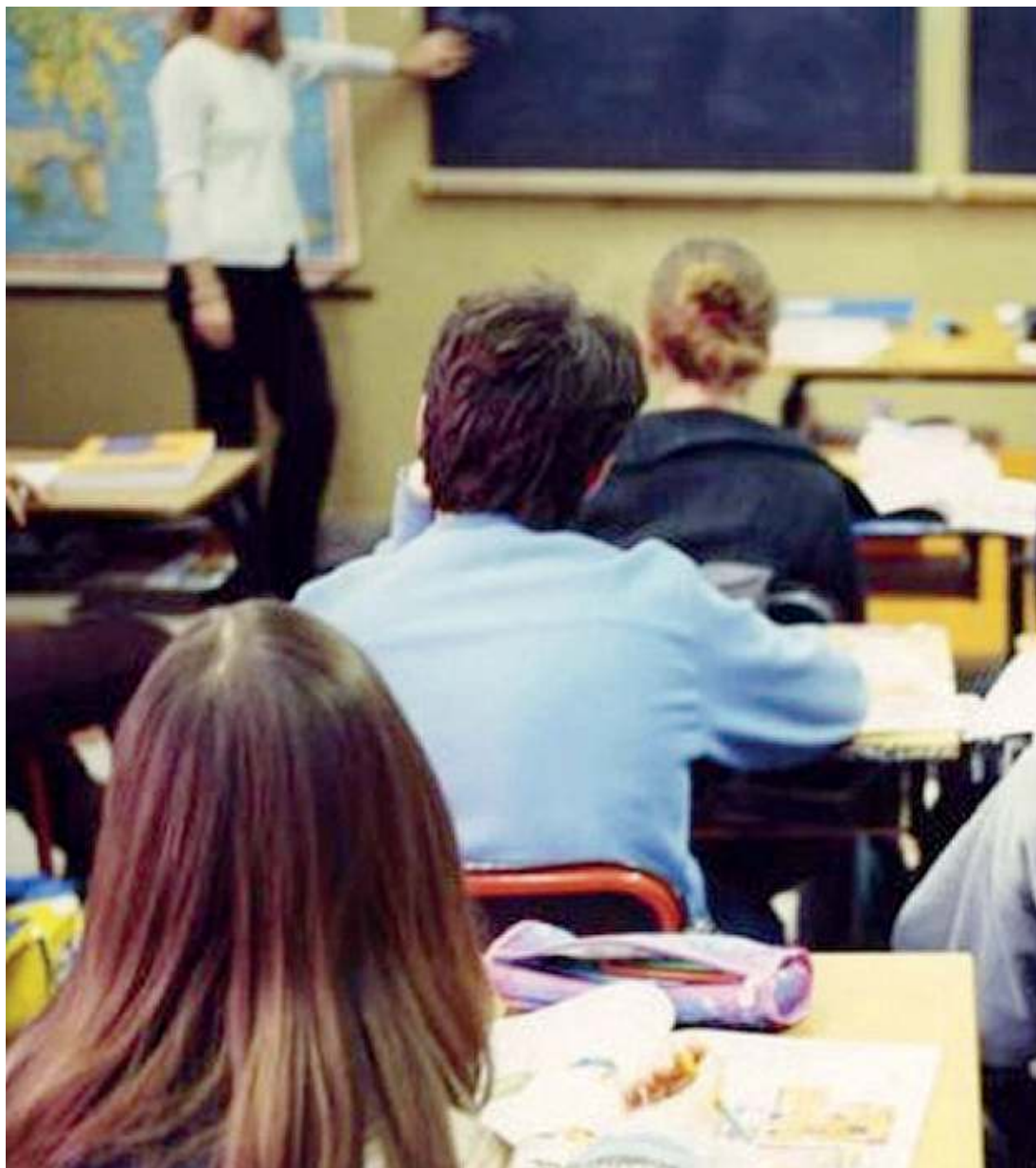
In classe. Un gruppo di studenti della scuola secondaria di secondo grado durante una lezione frontale

Il panorama. I sei licei sono classico, scientifico, linguistico, delle scienze umane, artistico e coreutico-musicale; al loro interno possono avere opzioni e curvature specifiche. Novità dell'anno scolastico 2024/2025: nell'ambito del Liceo delle scienze umane potrà essere attivato il Liceo Made in Italy.